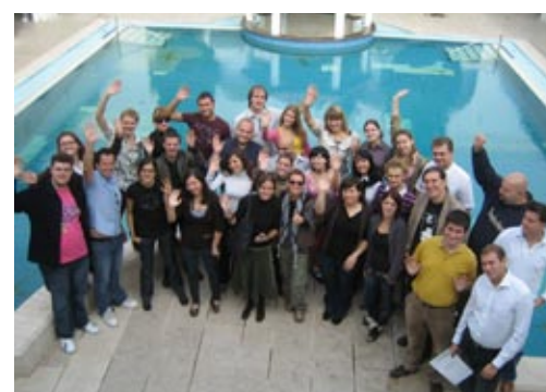
« Stand Up » pendant les Journées d'Information et de mise en réseaux sur l'Europe du Sud Est au Monténégro