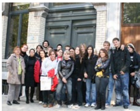
« Stand Up » devant le YFJ à Bruxelles