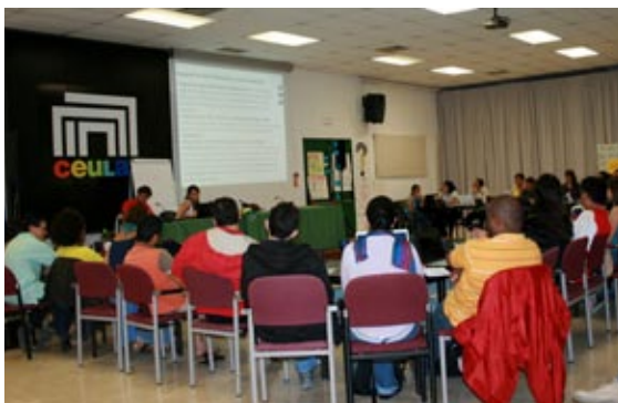
Participants au FEULAT formation

Le volet politique du FEULAT est d'avis que le renforcement des organisations de jeunesse et de la participation des jeunes conduira à un travail de lobby plus efficace et à une meilleure coopération entre